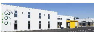
365 で販売しています。