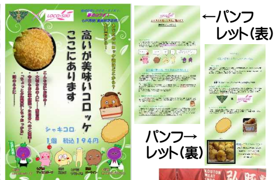
↑ ポスター (A1 版)

シャキココ班は、「シャキココ」にブランディング力を付けるため、誕生秘話を作成しました。株式会社 LOCO・SIKI のHP掲載の前に販売促進用のパンフレットとポスターを作成し、十和田市のスタンダードカフェ365にて掲載して販売しています。ぜひご覧になりお買い求め頂ければ幸いです。